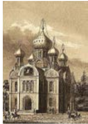
Рис. 2. Церковь святой великомученицы Екатерины (Екатерингофская), 1834 г., архитектор К. Тон