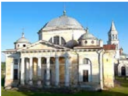
Рис. 3. Кафедральный собор в Торжке, 1785 г., архитектор Н.А. Львов