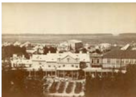
Рис. 4. «Воксал» в Озерках. Фото конца XIX — начала XX века

станции Шувалово, а после организации станции «Озерки» в непосредственной близости (предположительно, она была открыта сразу же после открытия «воксала») была возведена соединяющая их крытая галерея. Строение было квадратным в плане, с выступающей радиусной крытой эстрадой и с примыкающими с обеих сторон полуциркульными галереями (ил. 4). В экстерьере здания черты русского направления только наме-