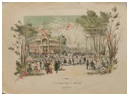
Рис. 5. Сад «Эрмитаж» в Москве. Рисунок К.Н. Чичагова для приложения к журналу «Россия» 1880-х годов

Среди организованных в 1880-х годах увеселительных садов Санкт-Петербурга самым значимым был сад «Аркадия», располагавшийся на территории старинного сада Строгановых близ Новой деревни. Эту территорию взяли в аренду купцы Г.А. Александров и Д.А. Поляков. В саду располагался грандиозный по масштабу комплекс строений. Главное здание «Аркадия», которое, по сути, представляло модифицированное здание «воксала». В нем прослеживалось сходство с планировочным решением «воксала» в Павловске и в Озерках. Отдельной постройкой выделялся летний театр, павильон для оркестра в саду, здание фермы, несколько буфетов и ряд других павильонов. Поскольку все здания были построены в русском стиле, то они «сливаются в одно гармоничное целое» [12, с. 46] (ил. 6), которое проявлялось как в композиции и структуре фасадов с