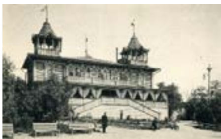
Рис. 12. Приволжский «воксал» в Саратове. Открытка конца XIX — начала XX века