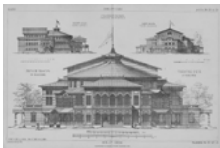
Рис. 3. Летний театр в Павловске по проекту архитектора Н.Л. Бенуа. Чертежи (Зодчий. — 1878. — Листы 20–21)

Это памятник романтической фазы историзма, и еще пока не имеющий никаких признаков русского стиля, однако в его планировке были заложены те принципы, которые станут обязательными для подобных комплексов. Павловский «воксал» имел вид квадратного корпуса, с примыкающими по бокам полуциркульными галереями и еще одной галерей, сообщающейся с перроном и станцией [4, с. 8]. Такая планировочная схема, вероятно, была использована в связи с находившемся по соседству Большим Павловским дворцом, как известно, возведенным в 1782–1786 годы по проекту архитектора Чарльза Камерона. Эти галереи, с одной стороны, являлись своеобразным узнаваемым визуальным «знаком» данной местности, с другой — необходимым архитектурным сооружением, соединявшем разные функциональные зоны. В дальнейшем такое решение будет применяться еще не раз при проектировании «воксалов».