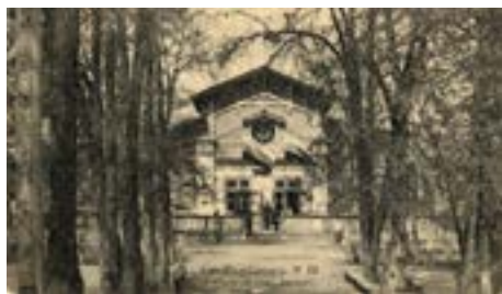
Рис. 9. Вид на «воксал» в Струковском саду в Самаре. Открытка начала XX века