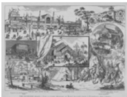
Рис. 6. Сад и театра «Аркадия» в Новой Деревне, близ С.-Петербурга. Рисунок Г. Бролинга для журнала (Всемирная иллюстрация. — 1884. — Том XXXII. — № 809)

Еще один такой сад «Аркадия» возникает на территории старых увеселительных садов в г. Астрахани. Именно в этом ансамбле наиболее ярко и целостно проявился русский стиль как в экстерьере, так и в интерьере построек. Комплекс создавался в 1899 году по проекту архитектора А. С. Малаховского (1859–1918?) и включал в себя связанные в единую стилистическую структуру «воксал», летний театр, открытую эстраду, здание для общественного собрания, входные ворота (ил. 7). Важно отметить, что деревянная архитектура увеселительных садов после 1880-х годов характеризуется более сложной многосоставной структурой и опирается на иные исторические источники — теремное деревянное зодчество XVII века. Композиционной доминантой в этом ансамбле являлась уникальная динамичная композиция летнего театра (ил. 8), образованная за счет врезки в полукруглый объем зрительного зала центрального трехэтажного портика с высоким щипцом, фланкируемого двумя башнями. Особую динамику композиции придавали лестницы, соединяющие башни с крытыми галереями. Здание выглядело легким за счет растворившегося объема стен за мерцающим резным де-