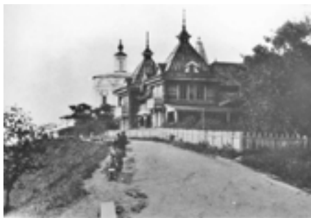
Рис. 10. Вид на «воксал» в Александровском саду в Вятке. Фото конца XIX века

«Воксал» в Александровском саду г. Вятке (сегодня г. Киров) (ил. 10) был построен на берегу реки Вятки в 1879 году архитектором И.В. Нефедьевым (1834–1888), который с 1876 по 1883 год занимал пост губернского архитектора Вятки и уже был известен как автор проекта деревянного театра [14, с. 69]. «Воксал» представлял собой двухэтажное деревянное строение, которое имело две массивные боковые башни с высоким палатным покрытием и выступающими на них объемами балконов, резной декор которых был решен в традиционном русском стиле. Главный фасад был выделен центральным мезонином. За счет достаточно лаконичного убранства, конструктивная основа хорошо считывалась. В изначальном проекте «воксала» художественная выразительность строилась на подчеркнутом контрасте между массивными бревенчатыми стенами и ажурными подзорами карнизов со сквозной резьбой (так же, как и в деревянном театре Нефедьева). Позже здание несколько поменяло свой облик после обшивки тесом, это решение лишило строение изначального художественного замысла и несколько упростило его. Важно отметить удачное расположение здания на высоком берегу, откуда открывался жи-