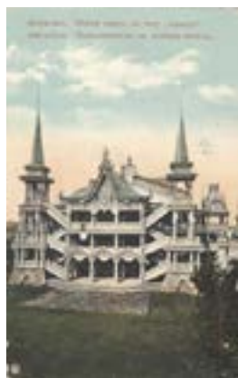
Рис. 8. Летний театр в саду «Аркадия» в Астрахани. Открытка начала XX века

Первым общественным парком Самары был так называемый Струковский сад, организованный в начале 1850-х годов. Свое название сад получил по имени бывшего владельца территории, действительного статского советника Г.Н. Струкова, который построил здесь усадьбу и разбил сад. Особого расцвета парк достигает в начале 1870-х годов после решения городской Думы о создании комиссии, следившей за состоянием общественного парка. Застройка сада представляла из себя комплекс зданий, включавших такие строения как «воксал» «изящной архитектуры» [1, с. 173], павильоны для торговли, будка для сторожа, грот, фонтаны, входные ворота и ограда. Сад располагался на живописной возвышенности, а с «воксала», по воспоминанием очевидцев, открывался «великолепный вид на Волгу» [1, с. 173]. Внешнее убранство строений было достаточно лаконичным, но уже просматриваются элементы декора, которые заимствуют из народного творчества (резные подзо-