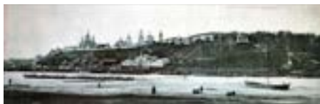
Рис. 11. Панорамный вид на «воксал» в Александровском саду в Вятке. Открытка начала XX века