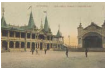
Рис. 7. Сад «Аркадия» в Астрахани. Открытка конца XIX — начала XX века