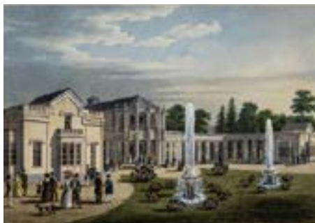
Рис. 1. Павловский «воксал». Гравюра Ф. Мартенса 1838–1844 годов

Павловский «воксал» (ил. 1) был построен по проекту архитектора А.И. Штакеншнейдера (1802–1865) и отделан к осени 1837 года, а с весны 1838 года здесь начали проводиться постоянные увеселения. Строение состояло из нескольких просторных залов для концертов, балов и обедов, двух зимних садов и жилых комнат для сдачи в аренду приезжающим [6, с. 22]. В 1844 году после пожара здание вновь было перестроено архитектором А.И. Штакеншнейдером (ил. 2).