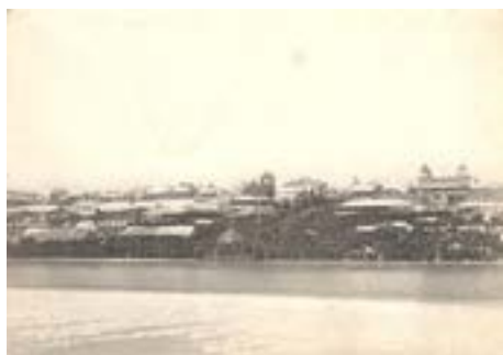
Рис. 13. Панорамный вид на Приволжский «воксал» в Саратове. Фото начала XX века

Ансамбли построек в увеселительных садах являются самобытным явлением в деревянной архитектуре русского стиля, в которых прослеживается развитие от «воксала», объединявшего под одной крышей самые разные сценарии проведения досуга, к строительству отдельных по своему функциональному назначению строений, образовывавших целые масштабные площади внутри садов. Изначально можно отметить, что главной доминантой ансамбля был «воксал», но, с распространением различных форм увеселительных мероприятий, комплекс начинает складываться из многообразных равнозначных строений. Чаще всего он включал