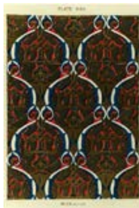
Рис. 9. О. Джонс, Ж. Гюри. «Альгамбра». Т. 2 (1845). Лист 14. Орнамент