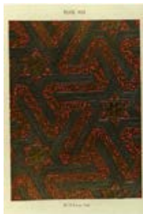
Рис. 16. О. Джонс, Ж. Гюри. «Альгамбра». Т. 2 (1845). Лист 22. Орнамент

ся, чтобы подчеркнуть особый статус тех или иных пространств. Так, в синагоге Эль-Трансито в Толедо (XIV в.) (рис. 13) этим орнаментом выделено место вокруг Ковчега Завета. Это говорит об особой функции орнамента, которая была воспринята архитектурой мавританского возрождения. Иными словами, и сам орнаментальный мотив, и его семантическая функция перестали быть элементом исключительно исламской архитектуры, но, распространившись за ее пределы, сохранили свой социально значимый статус как в общественных зданиях, так и в сакральных сооружениях других конфессий [12, с. 431, 433, 434].