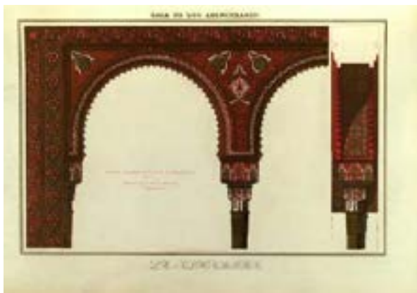
Рис. 4. О. Джонс, Ж. Гюри. «Альгамбра». Т. 1 (1845). Зал Абенсерахесов