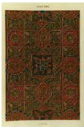
Рис. 15. О. Джонс, Ж. Гюри. «Альгамбра». Т. 2 (1845). Лист 30. Орнамент