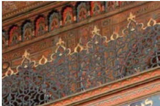
Рис. 17. О. Джонс, Ж. Гюри. «Альгамбра». Т. 1 (1845). Мозаики из бань и мечети в Альгамбре Рис. 18. Синагога Флоренции. Перила женской галереи

смешении первичных. Преобладание в их использовании характеризует эпохи упадка [8, с. 25, 70].