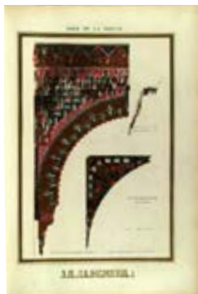
Рис. 3. О. Джонс, Ж. Гюри. «Альгамбра». Т. 1 (1845). Зал Лодок