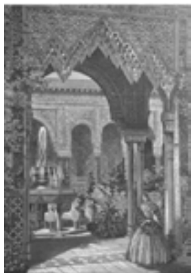
Рис. 7. Двор Альгамбры в Хрустальном дворце (1854)