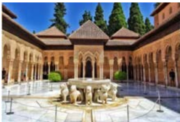
Рис. 8. Альгамбра. Львиный дворик (XIV в.)

екту архитектора Джозефа Пакстона был возведен Хрустальный дворец. Оуэн Джонс создал для этого здания концепцию декора, где применил полихромную систему оформления Альгамбры. Было использовано три основных цвета — красный, синий и желтый. Выбор этих цветов основан на изучении знаменитого испанского ансамбля, а также последних научных изысканий в области теории цвета и оптики [17, с. 84–85].