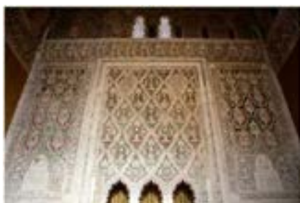
Рис. 13. Синагога Эль-Трансито в Толедо (XIV в.)