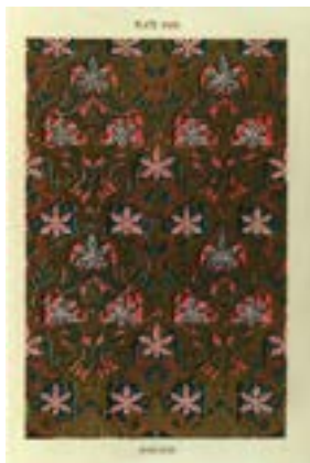
Рис. 14. О. Джонс, Ж. Гюри. «Альгамбра». Т. 2 (1845). Лист 18. Орнамент