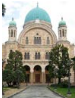
Рис. 1. Синагога Флоренции (1882)

Важным аспектом уравнивания евреев Италии в правах было упразднение гетто. Теперь