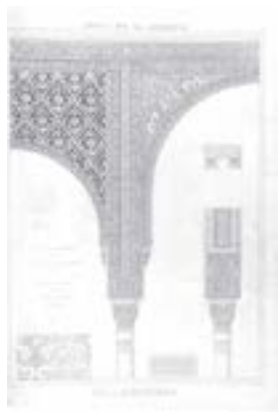
Рис. 11. О. Джонс, Ж. Гюри. «Альгамбра». Т. 1 (1845). Дворик Альберка

Себка — это ромбовидный орнамент, используемый в данном случае как двухмерное декоративное украшение гладкой поверхности. Своими корнями этот мотив уходит в трехмерное, рельефное украшение стены. Орнамент представляет собой не просто ромбы, внутри которых размещен тот или иной узор: изначально он предполагает три объемных слоя, наложенных друг на друга. Эти три слоя — растительные элементы, графичные элементы, включающие в себя надписи, и сами ромбы, которые, на самом деле, являются схематично изображенными переплетенными подковообразными арками. Происходит такая сложная и развитая структура из Капеллы Вильявисиоса в соборной мечети Кордовы (X в.) (рис. 12). Свод этого зала представляет собой сложную систему переплетенных арок, сконструированных на базе реберного свода, создающих впечатление сложной разветвленной сети. Этот мотив в дальнейшем воспринимался и совершенствовался, чтобы затем превратиться в орнамент себка. Часто орнамент себка использует-