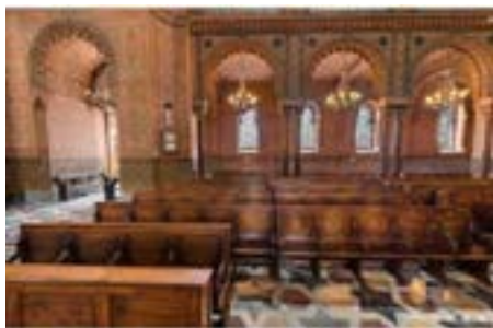
Рис. 2. Синагога Флоренции. Мольный зал

характерные типы орнаментации, витражи, которые в XIX в. ассоциировались, в том числе, с восточным «колоритом». Художником-декоратором, отвечавшим за оформление интерьеров флорентийской синагоги, был Джованни Панти. Последние исследования, посвященные ориентализму и синагогальной архитектуре XIX в., показали, что Панти изучал монографию Оуэна Джонса и Жюля Гюри «Альгамбра» (1845) [12, с. 472]. Так, изображения подковообразных арок с декором мукарнаса можно найти в работе Джонса и Гюри на листах с изображениями деталей оформления Зала Лодок и Зала Абенсерахесов [3, с. 96, 162] (рис. 3, 4). Капители аркад декорированы растительным орнаментом, состоящим из извилистых веточек и небольших цветов. Ниже расположена корзина из достаточно схематичных пальмовых листьев. Это же оформление капители во втором томе «Альгамбры» Оуэна Джонса и Жюля Гюри на листах под номерами 41 и 42 [4, с. 175, 179], то есть этот элемент имеет отчетливый «увражный» характер (рис. 5, 6).