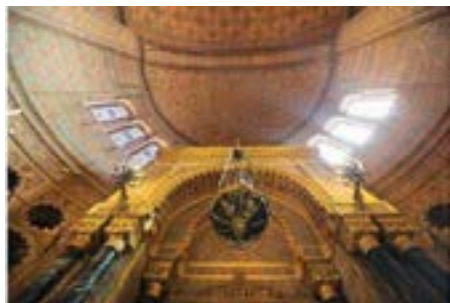
Рис. 19. Синагога Флоренции. Ковчег Завета и пространство апсиды

Таким образом, орнамент составляет основу декоративного решения внутреннего убранства Большой синагоги Флоренции. Им покрыты стены, полы и потолки здания, перила женской галереи и балдахин Ковчега Завета. Преобладающий вид орнамента во внутреннем пространстве флорентийской синагоги — орнамент себка. Вместе с ним встречаются цветочные и растительные узоры, геометризованные элементы, шестиконечные звезды и надписи на иврите. Важную роль в восприятии интерьера Большой синагоги Флоренции играет палитра орнамента. Она состоит преимущественно из красного, синего и желтого цветов. Только на нижней части стен и на полу использованы другие цвета. Мягкие, гармоничные цвета и повсеместное орнаментальное заполнение внутреннего пространства флорентийской синагоги соответствует декоративной концепции horror vacui . Все упомяну-